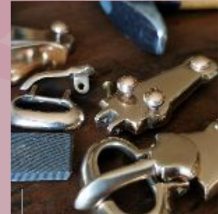
Bei der Herstellung der Rekonstruktionen wird auf jedes Detail geachtet.

Fachleute haben Kleidung, Waffen, Ausrüstung und Schmuck des Frühmittelalters nach aktuellem Forschungsstand rekonstruiert. Diese Dinge aus Leder, Metall, Textilien etc. kann man auch in die Hand nehmen.