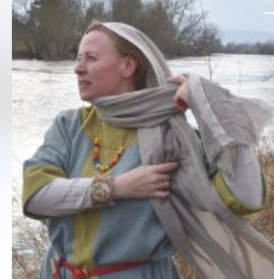
Die Ausstattung dieser sächsischen Dame basiert auf einem frühmittelalterlichen Grabfund.