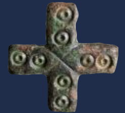
Kreuzfibel aus Höxter als Symbol des neuen Glaubens

Die Sachsenkriege Karls des Großen zogen sich noch Jahrzehnte hin, bis ins Jahr 804. Mit der fränkischen Herrschaft kam für die heidnischen Sachsen auch eine neue Religion. Die erfolgreiche Christianisierung der Sachsen bedeutet einen Kulturwandel und einen Aufbruch in eine neue Zeit, der bis heute unsere Gesellschaft prägt.