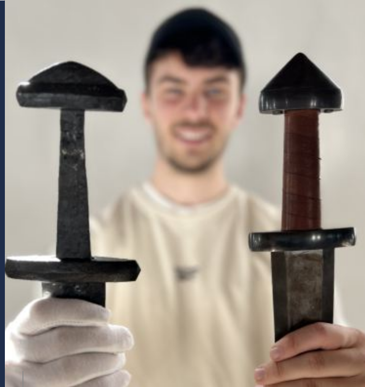
Langschwert (Spatha) des frühen Mittelalters: Originalfund und Rekonstruktion