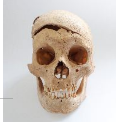
Schädel mit tödlicher Verletzung durch einen Schwerthieb